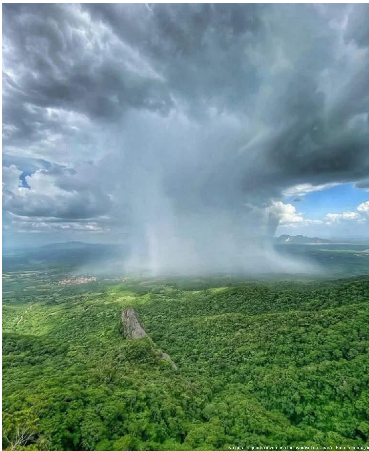
No geral a quadra invernal foi favorável no Ceará

Apesar do número elevado de cidades com precipitações inferiores ao esperado, o cenário geral do Ceará segue classificado como “levemente dentro da normalidade” em relação ao volume de chuvas acumulado ao longo da quadra chuvosa de 2026.