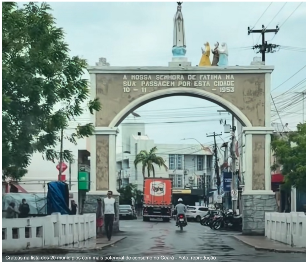
Crateús na lista dos 20 municípios com mais potencial de consumo no Ceará

Por segmento econômico, habitação lidera o ranking no Ceará, com R$ 47,7 bi projetados. Em seguida, aparecem alimentação no domicílio (R$ 25 bi) e veículo próprio (R$ 22 bi).