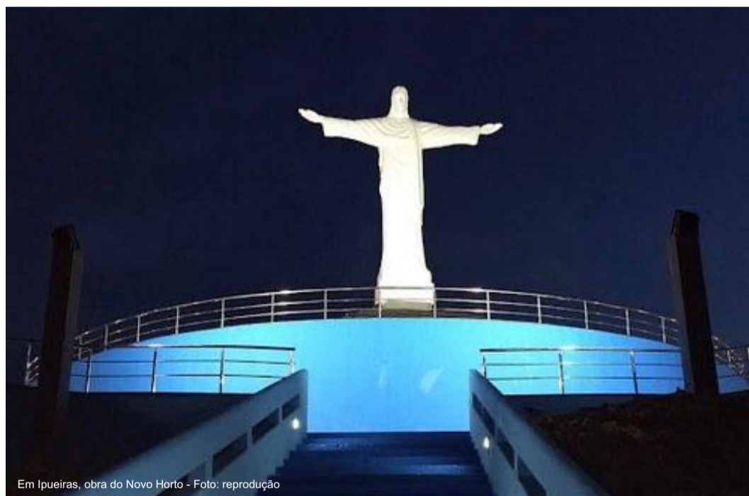
Em Ipueiras, obra do Novo Horto