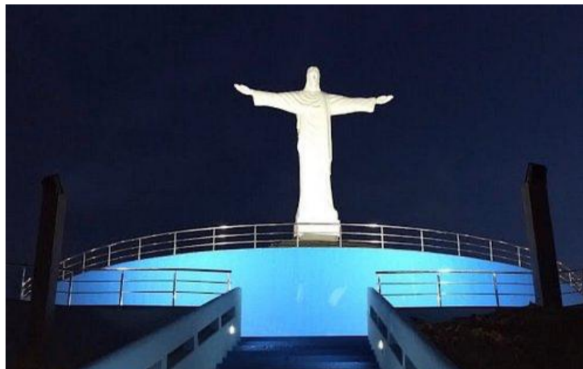
Novo Horto em obras, em Ipueiras, nos sertões de Crateús

O projeto contempla espaços que vão além da contemplação