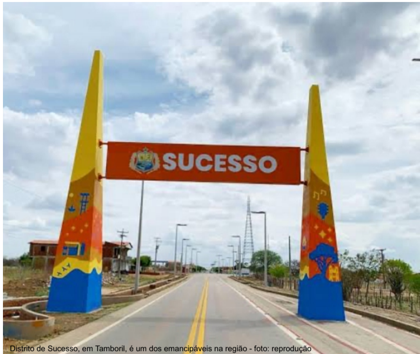
Distrito de Sucesso, em Tamboril, é um dos emancipáveis na região