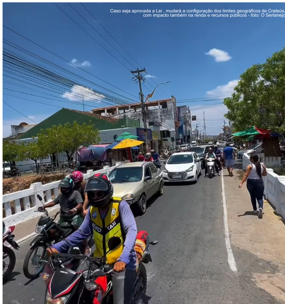
Caso seja aprovada a Lei, mudará a configuração dos limites geográficos de Crateús, com impacto também na renda e recursos públicos

O assunto volta a ser ventilado e debatido no Congresso após o deputado federal Allan Garcês (PP-MA) apresentar, no último dia 17 de dezembro, um requerimento solicitando à Mesa Diretora da Câmara a autorização para a retomada da tramitação do PLP 137/2015.