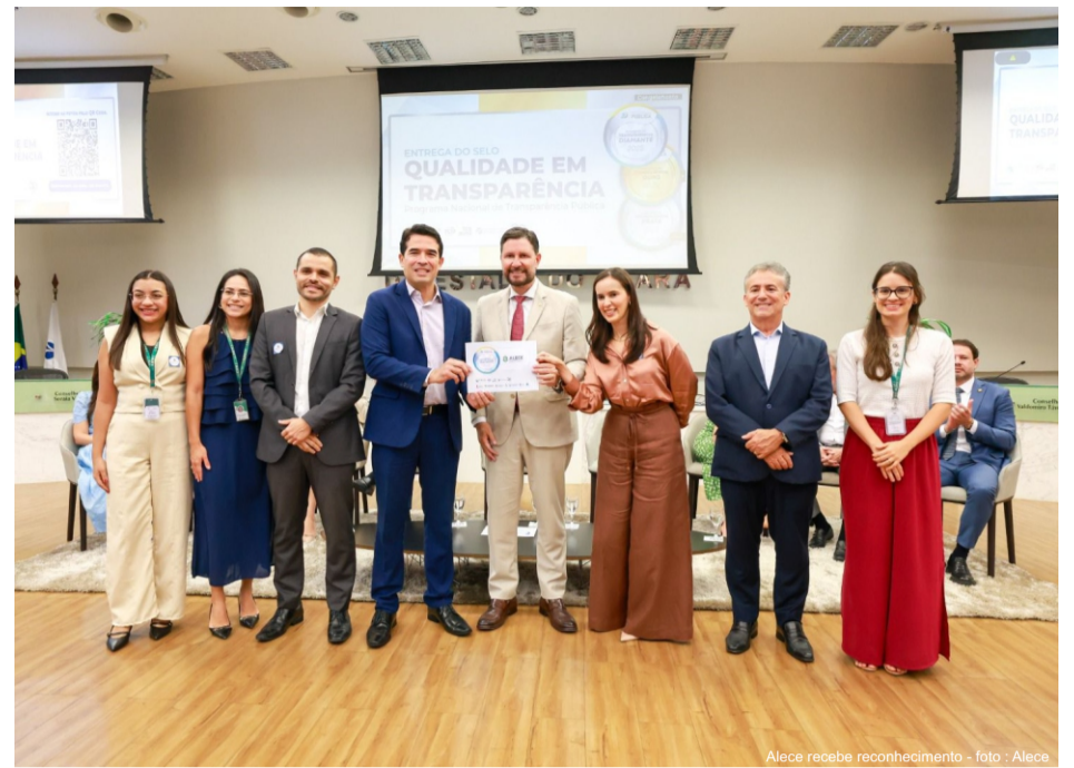
Alece recebe reconhecimento