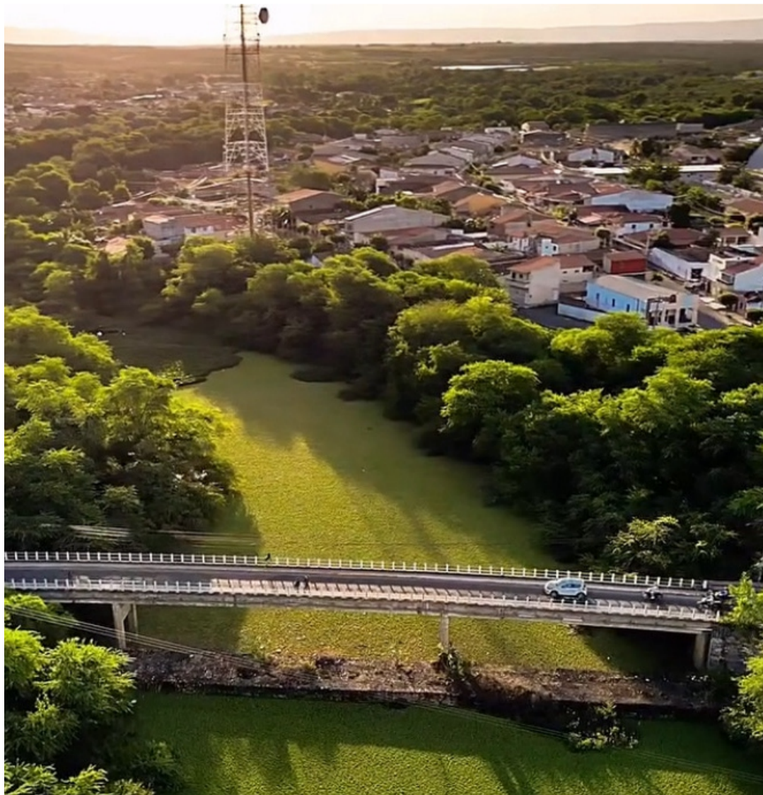
Crateús perderá além de Monte Nebo, Lagoa das Pedras, Santana e parte do Curral Velho, caso seja aprovada a Lei

Monte Nebo, em Crateús; Santa Tereza, em Tauá; Sucesso, em Tamboril e Lisieux/Macaraú, em Santa Quitéria são os distritos que pleiteiam emancipação política e administrativa na região e que podem se tornarem municípios caso o PLP 137/2015 seja