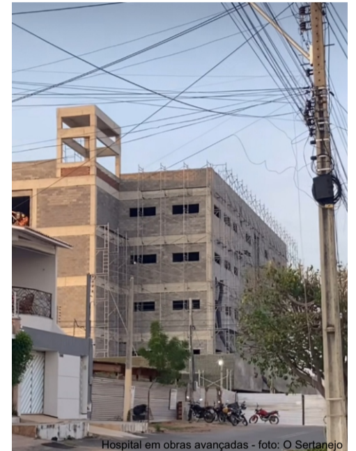
Hospital em obras avançadas