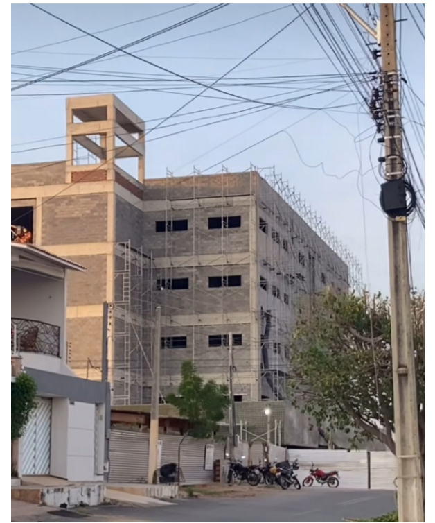
Hospital Regional dos Sertões de Crateús segue em obras

A unidade de saúde será dividida em térreo e quatro pavimentos. O térreo será destinado à urgência e emergência, contendo consultórios, salas de observação, sala de procedimentos, sala de medicação e outros compartimentos. O primeiro piso terá três unidades de