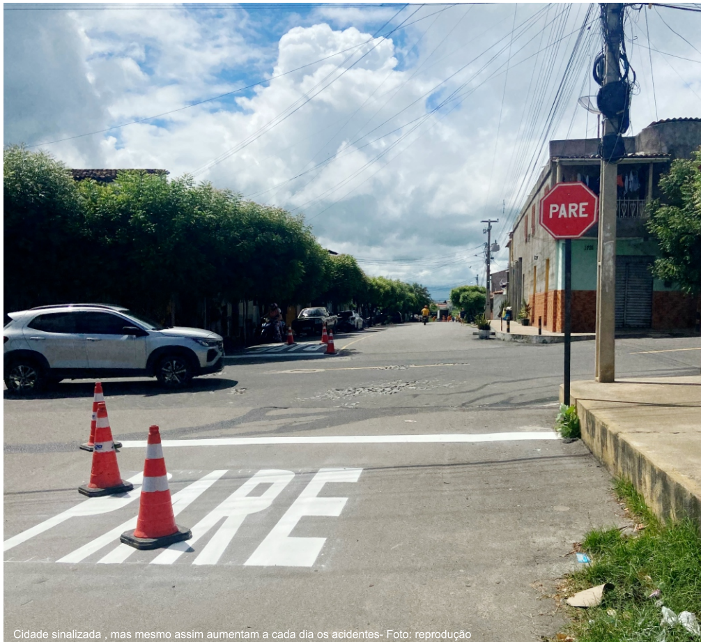
Cidade sinalizada, mas mesmo assim aumentam a cada dia os acidentes

Jovens, idosos, crianças, mulheres, todos, sejam pedestres, garapeiros ou condutores estão suscetíveis ao longo do dia e anoitecer a ser surpreendidos nas avenidas e ruas da cidade, com atropelamentos, quedas de motos, tombos, colisões, dentre