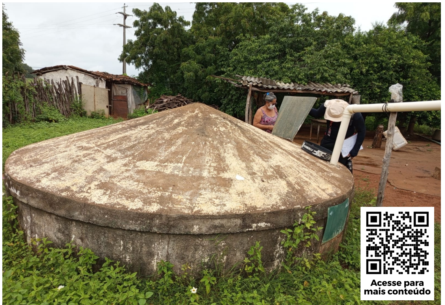
Projeto da UFC campus Crateús na zona rural da cidade - Foto: reprodução (UFC)