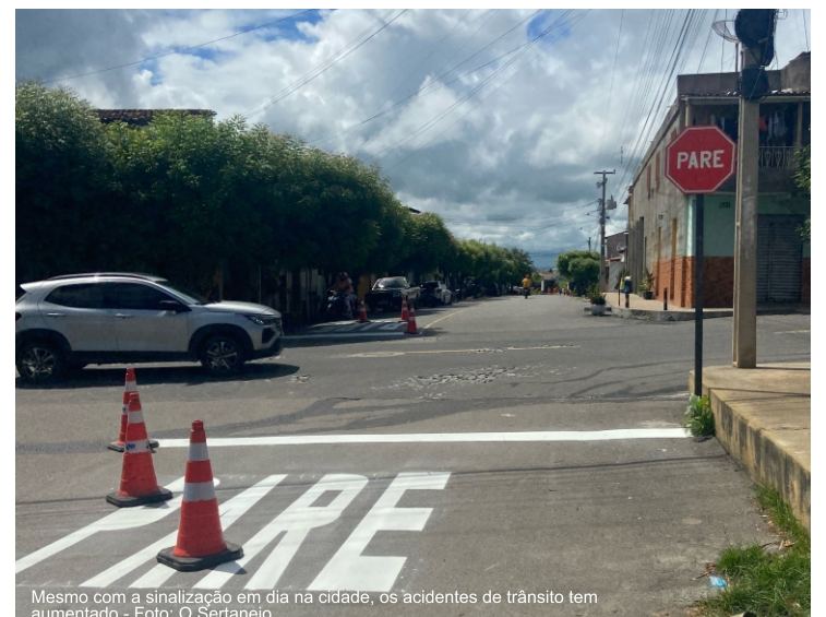
Mesmo com a sinalização em dia na cidade, os acidentes de trânsito tem aumentado