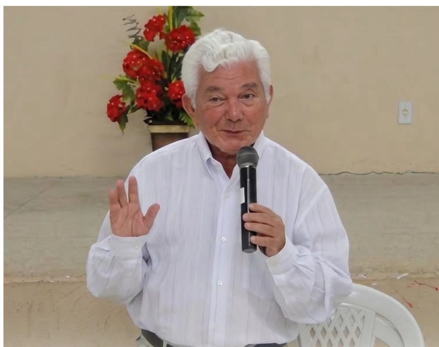
Padre Helenio