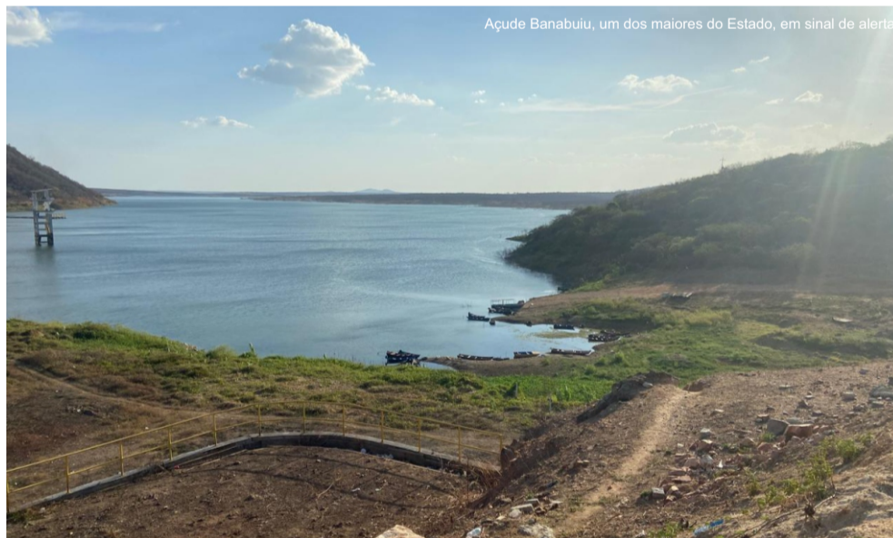
Açude Banabuiú, um dos maiores do Estado, em sinal de alerta

As chuvas de janeiro de 2025 se somaram às de fevereiro do mesmo ano, que registrou precipitações dentro da média, com 124,7 mm (2,8% acima da média histórica). Em 2026, as chuvas de fevereiro ficaram acima da normalidade (169,6 mm, 39,8% acima da média), mas não foram acompanhadas por janeiro, que ficou abaixo do normal.