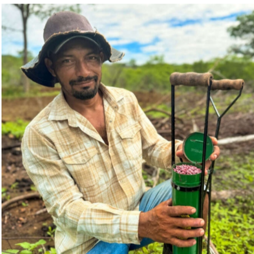
Retomada da cotonicultura no Ceará, começando pelos produtores de Tauá