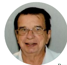
Por: Flávio Machado Escritor e historiador crateuense

Hoje não vejo mais carroças transitando por aqui. Agora, os carroceiros citados, quase todos desfrutaram das glórias celestiais e participam dos benefícios que Deus reserva para os justos.