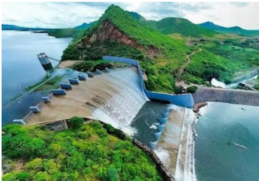
Açude Orós, próximo da sangria neste ano

A surpresa fica com os Sertões de Crateús, em que houve pequena elevação, com o volume saindo de 17,04% para 18,4%, embora ainda permaneça em situação crítica. A região tradicionalmente é a que acumula menos devido ser a mais árida do Estado.