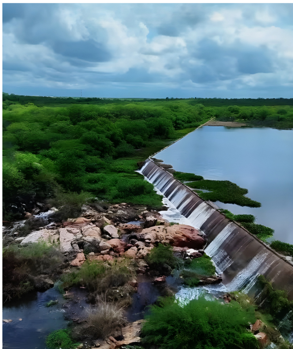
Barragem do Batalhão, em Crateús, em sua capacidade máxima neste inverno