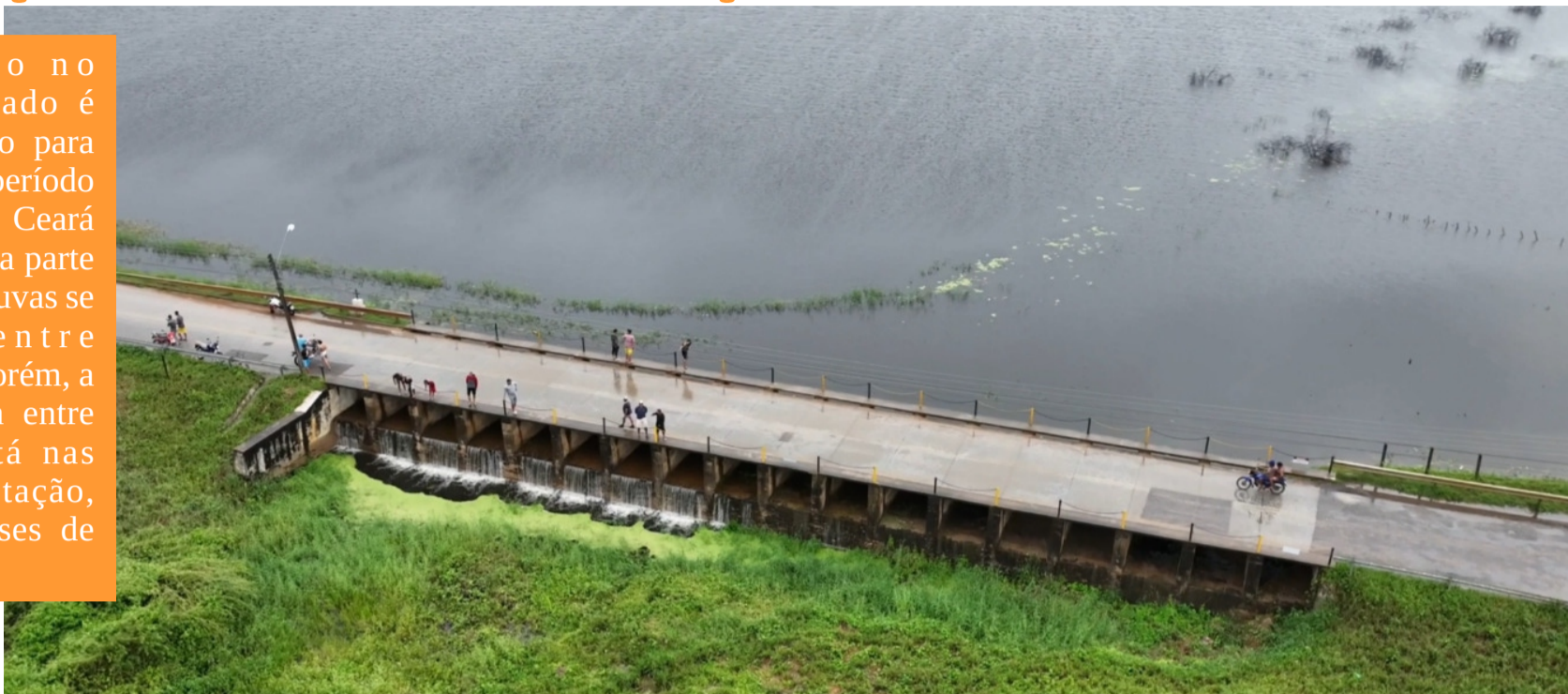
Açude São José III, em Ipaoranga, destaca com volume máximo

O volume de água armazenado nos açudes do Ceará apresentou queda em 2026 na comparação com o mesmo período de 2025. Dados do Portal Hidrológico do Ceará, da Companhia de Gestão dos Recursos Hídricos (Cogerh), mostram que o estado perdeu quase 1 bilhão de metros cúbicos de água em seus reservatórios.